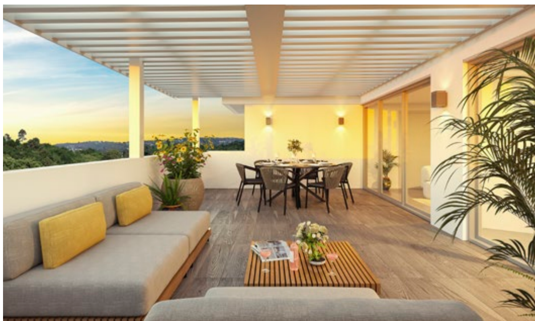
T4 | 3 chambres | Duplex | 105m 2

LES 36 APPARTEMENTS MEUBLÉS SONT RÉPARTIS ENTRE PLUSIEURS BÂTIMENTS DE 2 À 3 ÉTAGES À L'ARCHITECTURE ÉLÉGANTE FACE À LA BAIE DE FORT-DE-FRANCE.