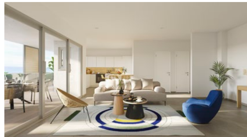
T2 | 1 chambre | de 40m 2 à 49m 2