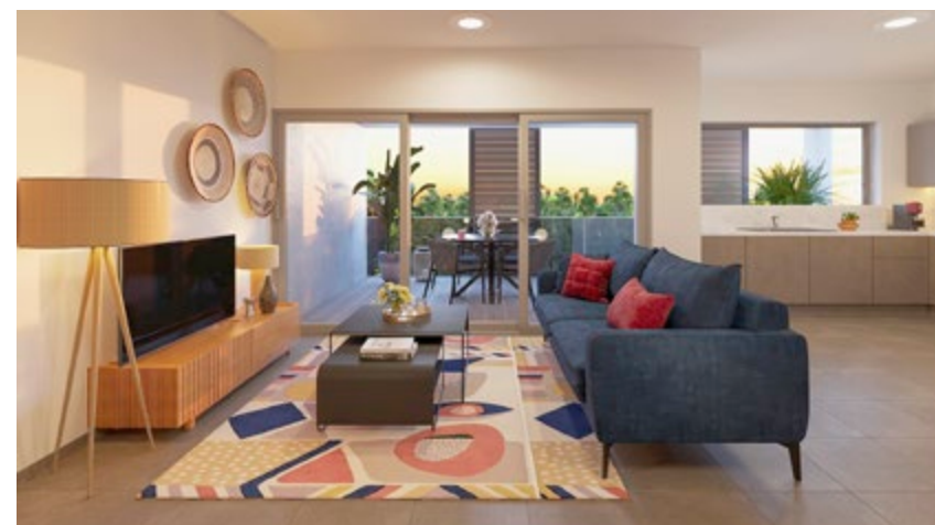
T3 | 2 chambres | de 51m 2 à 68m 2